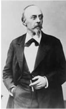
Hans von Bülow

Na de eerste uitvoeringen van het Requiem in 1874 was er toch iemand die zich negatief uitliet over het werk. En dat was de beroemde Duitse dirigent Hans von Bülow. Op 23 mei 1874 (een dag na de wereldpremière) liet hij een bericht plaatsen in een Milanese krant. Hij meldde dat hij de dag ervoor niet aanwezig was bij het spektakel in de San Marco. Hij bekritiseerde het werk nogal op een vijandige manier en beschreef het als Verdi's laatste opera in kerkkleding.... Pikant aan deze hele kwestie: het schijnt dat von Bülow het werk nooit gehoord heeft... Johannes Brahms reageerde na bestudering van de partituur: "Bülow's reactie is een ernstige blamage (Er hat sich unsterblich blamiert....). Zo'n werk kan alleen maar door een genie geschreven zijn". Pas in 1892 verontschuldigt von Bülow zich bij Verdi voor zijn "gran bestialita giornalistica".